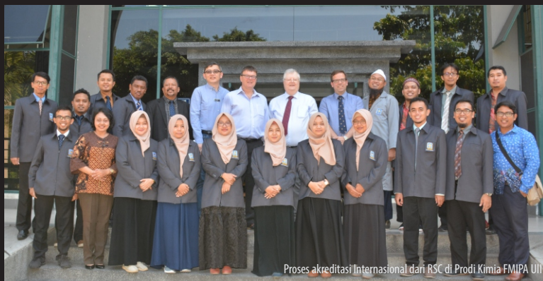
Proses akreditasi Internasional dari RSC di Prodi Kimia FMIPA UII